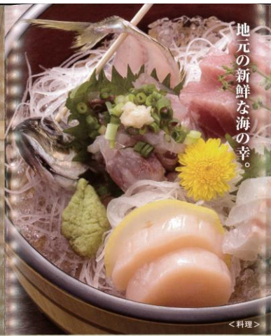
地元の新鮮な海の幸。