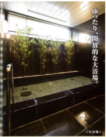
ゆったり、開放的な大浴場。