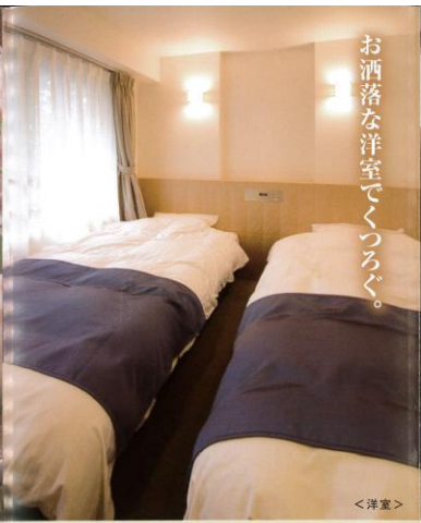
お洒落な洋室でくつろぐ。