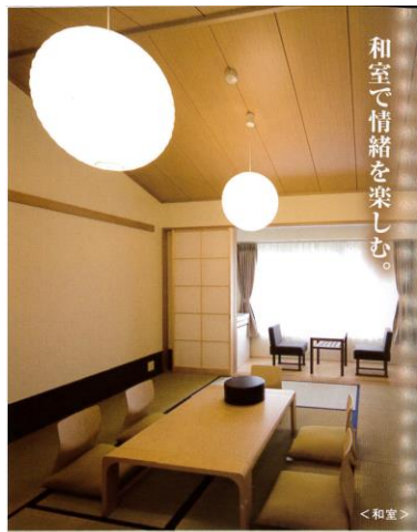
和室で情緒を楽しむ。